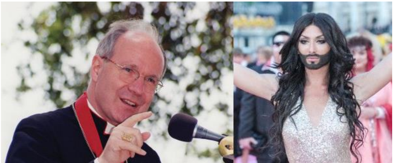
El cardenal Schönborn, primado de Austria, se regocija del triunfo de su compatriota, la « drag queen » Conchita Wurst, en el festival de la canción Eurovisión y pide a Dios que « bendiga su vida » pues « hay variedad de colores en su jardín multicolor. »