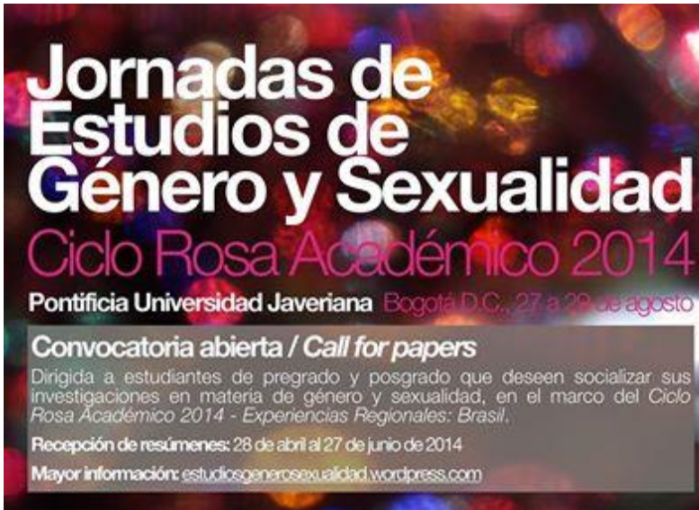
Universidad « pontificia » dirigida por los jesuitas al servicio de la ideología homosexualista, difundiendo la « teoría de género ».